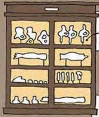
modelli in cera della articolazione dell'anca