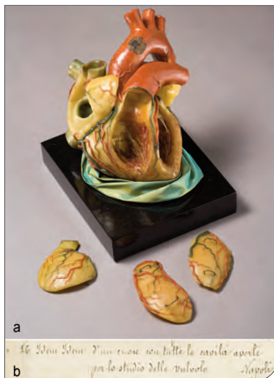
Fig. 4. Museo di Anatomia umana "Luigi Rolando" Università di Torino. a) Esempio di modello privo di etichette ma identificato come di provenienza napoletana in base alla descrizione riportata nel "Catalogo" alla sezione "acquistati a Firenze e a Napoli" al n. 26 (b).

AVATANELO L., MONTALDO S., 2003. La "Città della scienza" al Valentino . In: Giacobini G. (ed.), La memoria della scienza. Musei e collezioni dell'Università di Torino . Fondazione CRT, Torino, pp. 89-96.